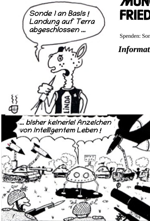
Nach einem TOM-Comic

Bei Interesse – Anmeldungen oder Anfragen willkommen, oder auch gerne spontan mitmachen: info@bifa-muenchen.de , Tel. 089 3085591